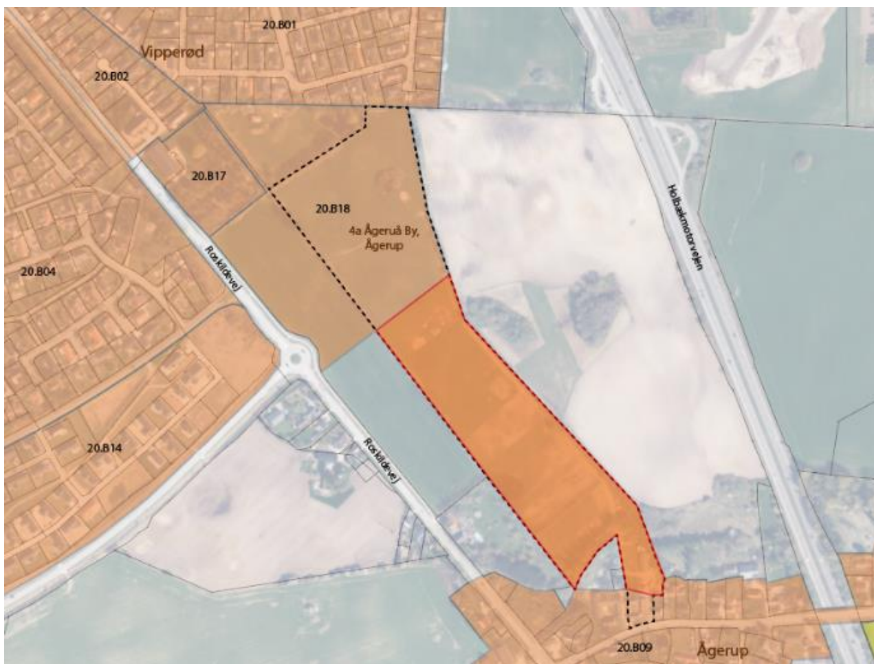
Kortet viser matr.nr 4a med sort stipleet linje. Men tydeligere Orange og rød outline er området der foreslås udlagt til bolig med kommende Kommuneplan 2024.

I forslag til Kommuneplan 2024 udgår begrebet perspektivområder, hvilket begrænser mulighederne for en sammenhængende byudvikling i området mellem Vipperød og Ågerup. Det foreslås derfor, at hele matr.nr. 4a Ågerup By, Ågerup udlægges til boligområde i Kommuneplan 2024.