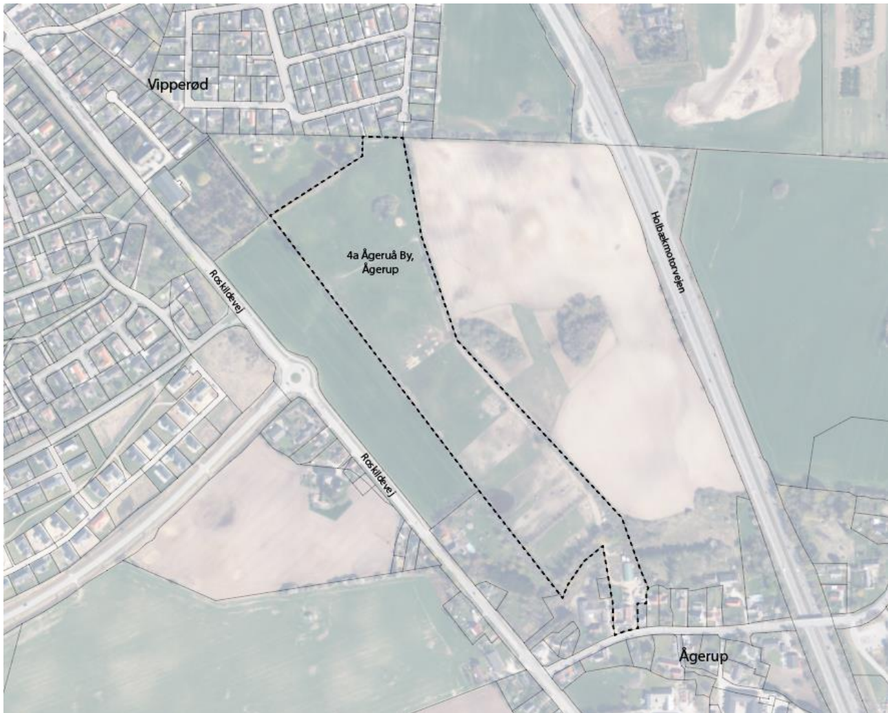
Forslag til arealudlæg til fremtidigt boligområde ved Vipperød sydøst

Dokument: Høringssvar til forslag til Kommuneplan 2024