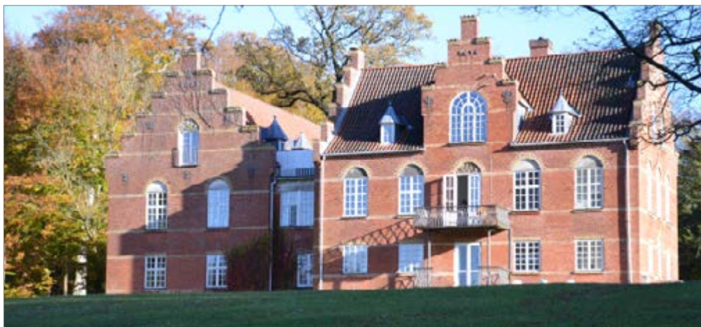
Sølyst set fra søen