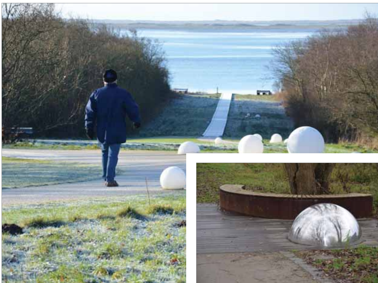
Inspiration fra Hjerting Strandpark og Kolding Å