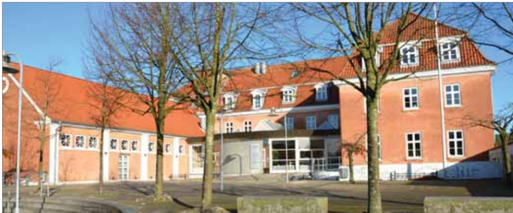
Bibliotek og aktivitetsplads i bymidten

Byen er overordnet set delt i byen nord for den kommende motorvej og byen syd for motorvejen. Forbindelsen mellem de to bydele foregår alene ad Holbækvej og den niveaufri gang- og cykel forbindelse mellem Industrivej og skolen. Besøgsmaale ne forbindes med veje og stier. Nogle steder kan trafikikkerheden og fremkommeligheden højnes, hvilket eksempelvis bør ske på Holbækvej og industrivej.