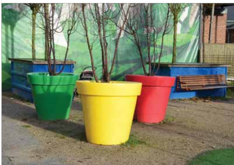
Eksempler på byinventar fra Vejle og Esbjerg