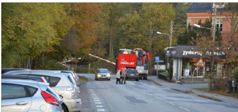
Besværlig krydsning af Sølystvej