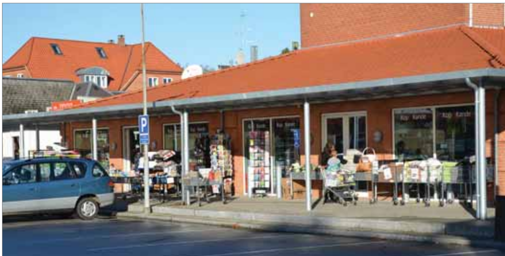
Udvalgs varebutik i bymidten

Her bør det overvejes at udvide afgrænsningen mod vest ud mod Sølystvej og kom-bineres med etablering af en trafikssikker adgang for gående til Sølystområdet. Vi-suelt kan der skabes en indbydende udsigt til Skarresø. Desuden bør bymidteaf-grænsning udvides mod syd. Dette vil muliggøre etablering af byrum og torvedan-nelser med bygninger på alle fire sider.