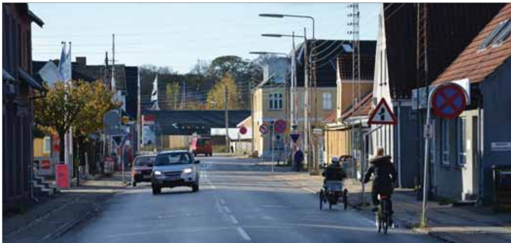
Holbækvej set fra nord mod jernbaneoverskæringen

Det vil være hensigtsmæssigt med etablering af en parkeringsplads for pendlere i nærheden af stationen. I bymidten kunne træbeplantning på parkeringspladser være med til at give bymidten en mere indbydende karakter.