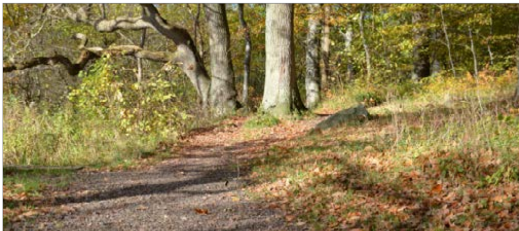
Jyderupstien vest for bymidten